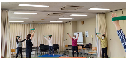
ゴムバンドを使ってスロー筋トレ