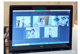
パソコンからの見え方はこちら

「天候に関係なく出来るところが良い。」 「みんなで和気あいあいと楽しくできました。」 「出掛けなくても体操ができるところがよかった。」 「講師が身近に感じられるので、親近感があって良い。」