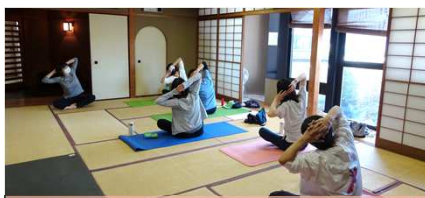
姿勢の改善、気持ちを前向きに