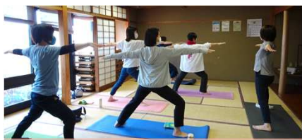
精神の安定・代謝アップ