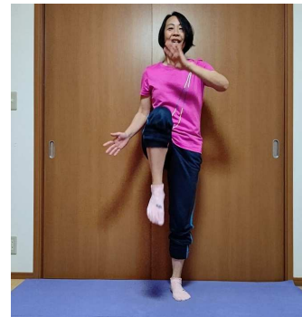
リズム体操指導中 “皆さん一緒に”

コロナ禍でも安全に運動ができるオンラインレッスンを行っています。パソコン、タブレット、スマホがあれば、ご自宅など好きな場所で講師の指導を受けながらストレッチや筋トレができます。オンラインレッスンが初めての方には、機器の使い方から学んでいただけます。