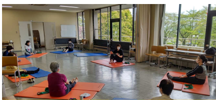
トレーニングの説明も念入りに

4月から80代の若々しくお元気な6名の皆さんが新しく参加してくださいました。在籍中のメンバーと一緒に、世代を超えて、楽しく心身のエクササイズができるのではと期待しています。コロナ禍での開講で、この先又、緊急事態宣言等の発出により、休講せざるを得ない事態も発生するかもしれませんが、臨機応変に対応していく所存です。