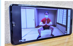
スマホではこのように見えます

「高齢になると同じ姿勢で長いる時間が増えるため、柔軟性を高める、ストレッチの大切さを感じます。」